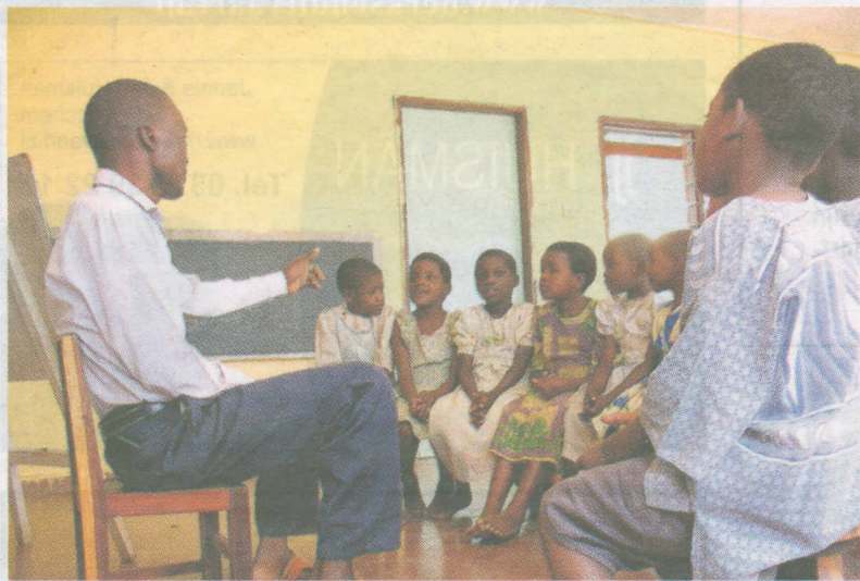
Kinderen krijgen les op een school in het Afrikaanse land Malawi.